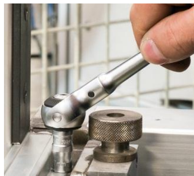
Position avec léger dégage-ment