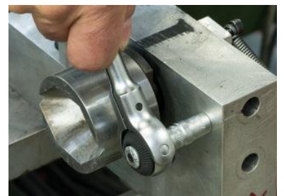
Position cliquet 90°