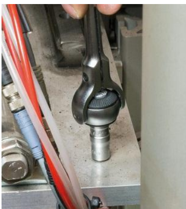
Position tournevis 0°